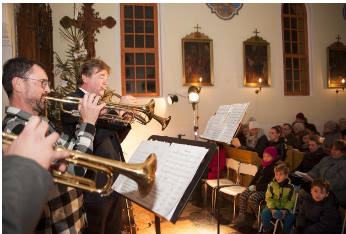
Vystoupení kapely KP58 – koncert v kostele, prosinec 2017