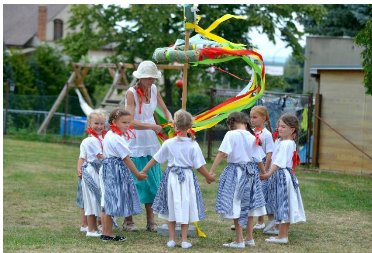
Vystoupení tanečního kroužku