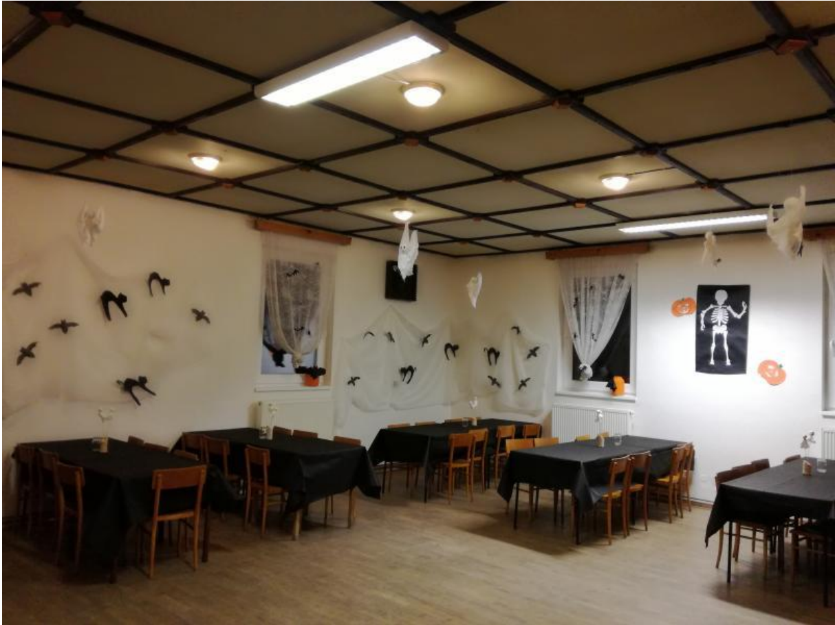
Výzdoba Hospůdky u hřiště na Ples příšer