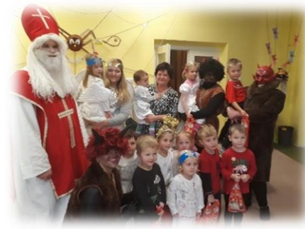
Mikulášská se studenty (Sluníčka + Kotátka)