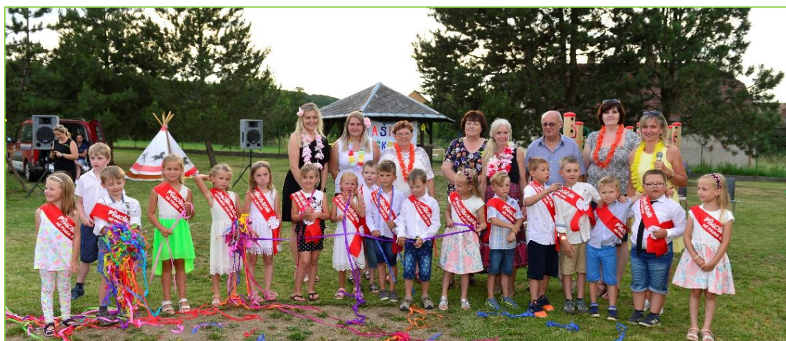
Společné foto na závěr

Také vám připadá, že se do školy všichni moc těší? Připadají Vám najednou nějak dospělejší? Chtějí vám pomáhat? Chtějí mít zodpovědnost za cokoli? Jsou dětmi, které mají rády své okolí, rodiče, paní učitelku ve školce, domácí mazlíčky. Zajímají se o všechno a stále se na vše vyptávají? Dovedou si již hrát samy, a stále více při tom napodobují činnost Vás dospělých? Holčičky si hrají na maminky a na vaření, kluci opravují, montují, hrají si na vojáky nebo na piloty. Rády si nechávají číst, ale začínají je zajímat spíše realistické příběhy, než pohádky o zvířátkách nebo princeznách. Určitě uvítají i nějaký dětský časopis, ve kterém si budou nadšeně listovat.